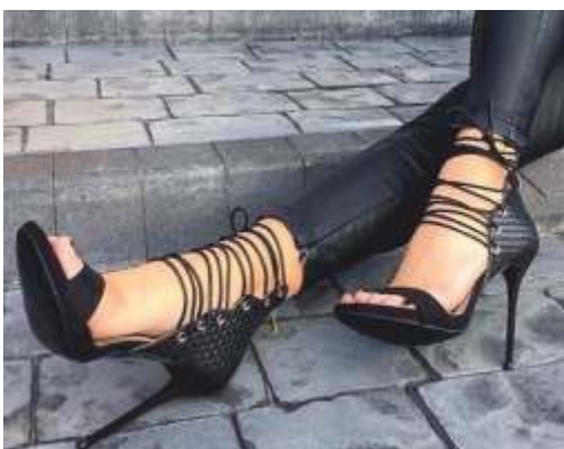
Bellezza e praticità attraverso il tempo.