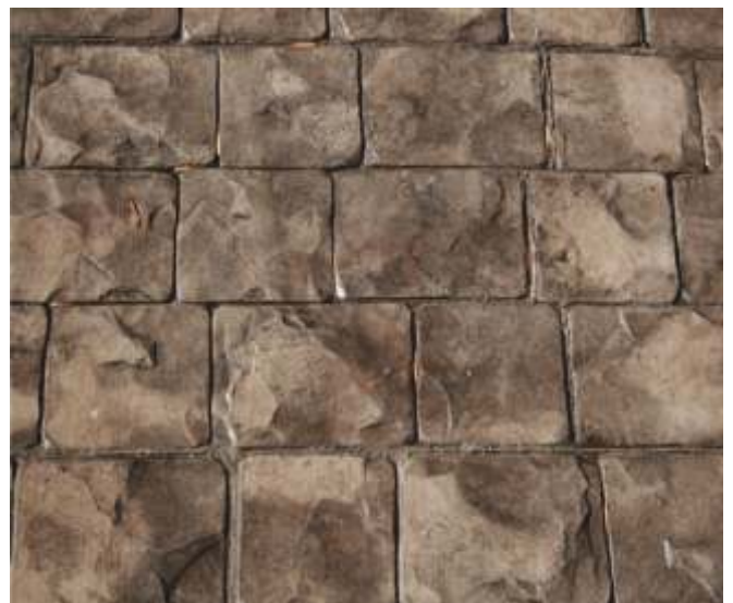
Beauty and usability throughout the year.