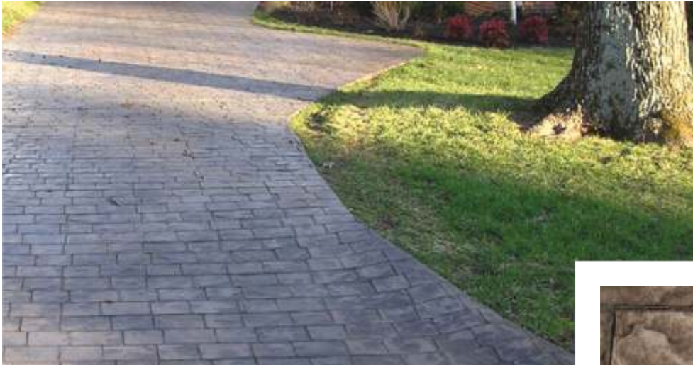
The strength of monolithic flooring throughout the year.